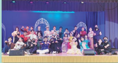
The Joy of English Drama

For students who are more into the performing arts and those who simply are active and have endless energy which can be diverted elsewhere, the English Drama Club is the school club they are destined for. The Club provides the perfect opportunity for students to act, sing, dance, and most importantly have fun while learning English.