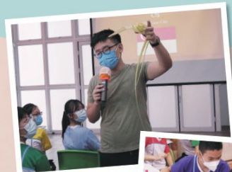
A Trip to Singapore

While English teachers at LCK put immense effort and energy into broadening students' horizons, we understand that none of these would be possible without God. We hope that students understand that we all, despite our differences, are created equally in His image and learn to live in harmony. May we take this opportunity to sing praise to Him for all His wonderful acts.