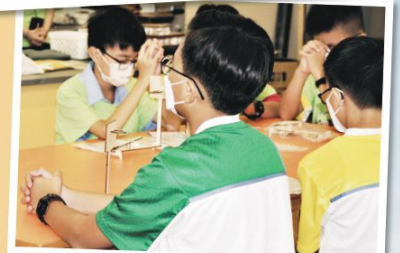
We end every day of activities with prayers so that students learn to be grateful and put their lives in the hands of the Lord.