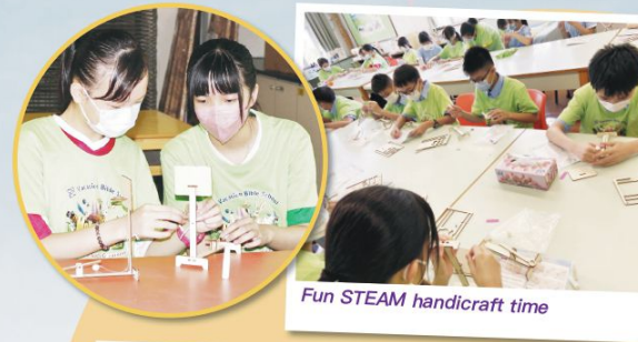
Fun STEAM handicraft time