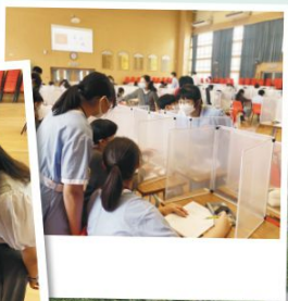
上「大課」時的學習情況

需要，培養同理心。學生面對面跟長者訪談，傾聽他們訴說「獅子山下的故事」，接連兩代人，領悟香港人精神，再配合宗教堂上從聖經認識敬老愛老的道理，培育出感恩敬人的精神。旁觀的老師們、機構專業人士一同見證學生們的成長，一同感受學習活動的意義，為之著迷，可算「旁觀者迷」。