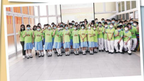
Class photo of Classes 1C and 1D