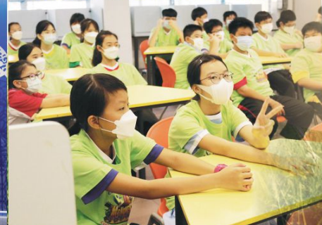
Students learning more about the story of Joseph from the Bible in an interactive way.