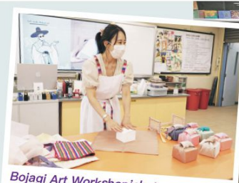
Bojagi Art Workshop