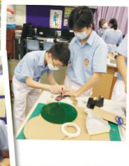
學生們為長者設計 STEM 產品