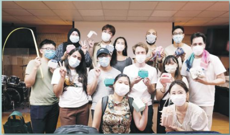
The team of Global Culture ambassadors

Strength lies in differences, not similarities – Stephen R. Covey