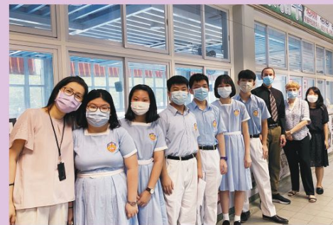
The backbone of the English Society

LCK provides students with a rich English learning atmosphere which serves as a good springboard for students of diverse English competencies to advance to a higher level of English proficiency. Immersed in a vibrant English environment, students can participate in countless co-curricular learning activities, freely engage with our NET teachers, and dive deep into the world of English literature and popular art forms in the library. To learn the language in more relaxing ways, students can sign up for the English Society and the English Drama Club - two key school clubs shouldering the promotion of English learning on campus.