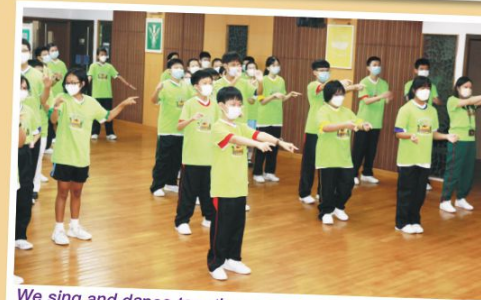
We sing and dance together to celebrate God's greatness.