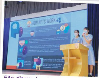
EAs discussing the mechanism of NFTs

As we provide students with an expansive English-rich environment, we are also building their confidence and celebrating students' achievements. May we continue to find strength in God as we foster the English learning of LCKers.