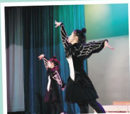
They got the moves of flamingos and the voices of nightingales

There is no doubt that English learning is at the core of this Club but we shall never miss out on any chances to impart the correct values and attitudes to our students. Through rehearsals, we also nurture students' perseverance, professionalism, respect, and teamwork, which are all essential qualities for Drama, English learning, and life in general.