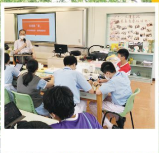
同學訪問長輩了解舊香港

在整個「香港傳耆」學習活動中，我們體驗長者日常生活可能面對的困難，再設計和製作解決相關困難的產品。過程中，除了學會創新科技和編程知識，更懂得要關懷這群過去為香港付出的長者。在小組協作的過程中，我們學會保持包容和尊重，透過溝通去解決組員間的意見分歧。在此，我衷心感謝各位老師，為我們的學習帶來突破，發掘我們未知的潛能！