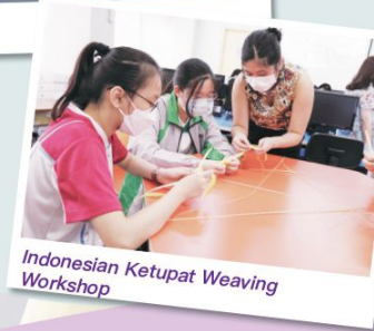
Indonesian Ketupat Weaving Workshop