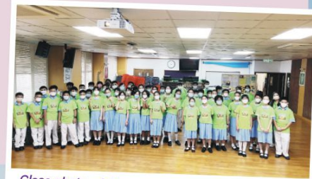
Class photo of Classes 1A and 1B

Our program aims to provide an enriching learning experience to students through dynamic dancing and singing of hymns, interactive meaningful games, vivid Biblical stories, and fun STEM handicrafts. Not only can this consolidate their learning and enhance its effectiveness, but this can also help students gain a deeper understanding of the positive values from the Bible and God's greatest love. We envision that these new LCK students can seize opportunities and handle challenges they may come across as they grow up with a positive attitude and most importantly with God's love.