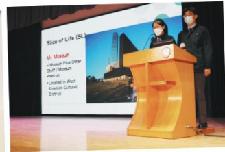
EAs introducing the M+ Museum