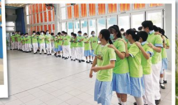
Students understand that God is always with Joseph to help him get out of adversity through some fun time!